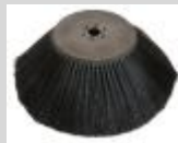
Zijborstel Art nr 0.961.0007 Met staaldraad gemengd Art nr 0.961.0023