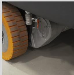
Sterke wielen voor alle werkcondities