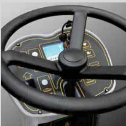
Overzichtelijk en eenvoudige bediening

Na de succesvolle introductie in meer dan 100 landen, eindelijk ook in België! Met de kennis en knowhow sedert 1975 is de Comfort M van Lavor topklasse. Comfort M is de partner voor elke grote parkeergarage, logistiek bedrijf en industrie. De topprestaties zorgen voor een uitstekend rendement. Met een tankinhoud van 210 liter en werkbreedte van 1000/1250 mm is een lastige klus in een mum van tijd geklaard. De twee krachtige borstels (1000 mm) zorgen voor dieptereiniging en de zuigbalk (1250 mm) maakt de vloer meteen droog. De zuigbalk en borstels werken automatisch (zonder hendel) en zelfs bij achteruitrijden gaat de zuigbalk automatisch omhoog. De sterke stalen V-vorm zuigbalk, samen met de sterke zuigkracht, zorgt voor een perfect droog resultaat op elk type vloer. Met de speciale filterbox wordt opgezogen vuil apart verzameld, zodat de afvoer niet verstopt geraakt. Met het elektronisch vlotter systeem stopt de machine wanneer de vuilwater tank vol is. Vanaf het controle paneel kan de bestuurder o.a. de snelheid van werking regelen en de hoeveel toevoer water op de borstels. Het leegmaken proper water tank gebeurt via een ventiel onderaan de machine.